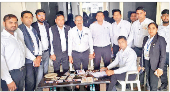
गन्गौर। मतदान के दौरान उपस्थित गन्गौर बार एसोसिएशन के सदस्य।

पंजाब एवं हरियाणा बार काउंसिल के चुनाव बुधवार को जिले में शांतिपूर्ण और व्यवस्थित तरीके से संपन्न हो गए। जिले में 2782 में से 2090 अधिवक्ताओं ने अपने मताधिकार का प्रयोग कर 157 प्रत्याशियों के भाग्य का फैसला बैलेट बॉक्स में बंद कर दिया। अब सभी की निगाहें मतगणना और परिणाम पर टिक गई हैं। जिले में चुनाव प्रक्रिया एसडीएम सुभाष चंद्र की देखरेख में संपन्न कराई गई। मतदान के लिए सोनीपत में तीन जबकि गन्गौर और गोहाणा में एक-एक मतदान केंद्र स्थापित किए गए थे। सुबह से ही अधिवक्ताओं में मतदान को लेकर उत्साह देखा गया और दिनभर मतदान केंद्रों पर व्यस्तता का दृश्य प्रकट होता रहा। चुनाव में कुल 23 सदस्यों का चयन किया जाना है, जिसके लिए पंजाब एवं हरियाणा बार काउंसिल के 157 प्रत्याशी मैदान में हैं। मतदान सुबह