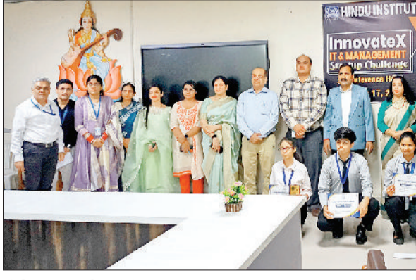
सोनीपत। प्रतिभागी छात्रों के साथ अतिथि एवं महाविद्यालय का स्टाफ।

हिंदू इंस्टीट्यूट ऑफ मैनेजमेंट में "इनोवेटिक्स: इंटर कॉलेज स्टार्टअप चैलेंज" का सफल आयोजन किया गया। कार्यक्रम में विभिन्न कॉलेजों के प्रतिभागियों ने विभिन्न मॉडल, एआई आधारित शी शील्ड सेफ स्पेयर (एस4), रेंट एवरीथिंग प्लेटफॉर्म, किसान कनेक्ट और क्यूरेटर लैब्स जैसे