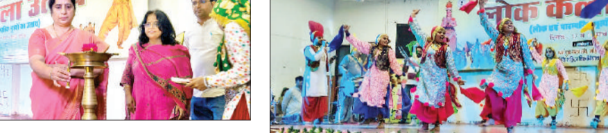
हरिभूमि न्यूज ►► गोहाणा