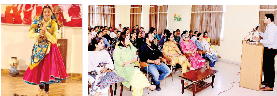
सोनीपत। टीकाराम शिक्षण महाविद्यालय में प्रस्तुति देते विद्यार्थी व स्टाफ और विद्यार्थी को जानकारी देते हुए बैंक मैनेजर।