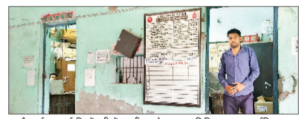
गन्नौर। ईएसआई डिस्पेंसरी में ड्यूटी पर केवल एक चिकित्सक व फार्मासिस्ट।

बड़ी औद्योगिक क्षेत्र में ईएसआई डिस्पेंसरी में कार्यरत कर्मचारियों पर इलाज के लिए जाने वाले मजदूरों ने ड्यूटी में कोताही बरतने का आरोप लगाया है। वही जब ईएसआई मंत्रालय को डिस्पेंसरी में पाया गया कि शाम की शिफ्ट में चिकित्सक के अलावा केवल एक फार्मासिस्ट के भरोसे पुरी डिस्पेंसरी चल रही थी। चिकित्सक न पछुने पर बताया कि वे तो यहां अप्रेंटिस कर रहे हैं। वही मामले की