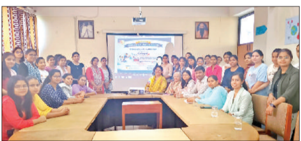
गोहाना। कार्यशाला में उपस्थित प्रतिभागी व अतिथि।