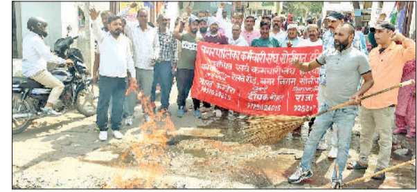
सोनीपत। नगर निगम कार्यालय के गेट पर प्रदर्शन कर पुतला फूँकते सफाई व अग्निशमन कर्मचारी।